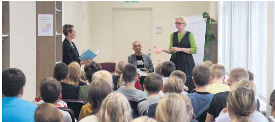
Eesti lastekirjanduse keskuse lastekirjanike tuur jõudis raamatuaastal ka Järva valda.

Vahvat elevust tõi Järva vallaraamatukogu „Tähesegadik“, mis