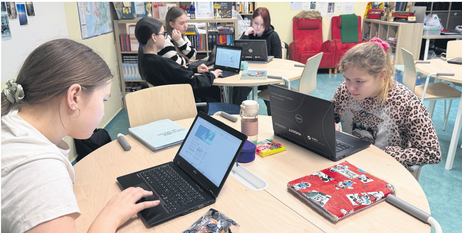
GreenDice külastas Imavere kooli ning jagas digitarkust.