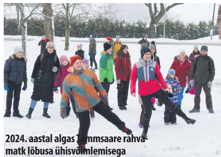
2024. aastal algas Tammsaare rahvamatk lõbusa ühishõimlemisega